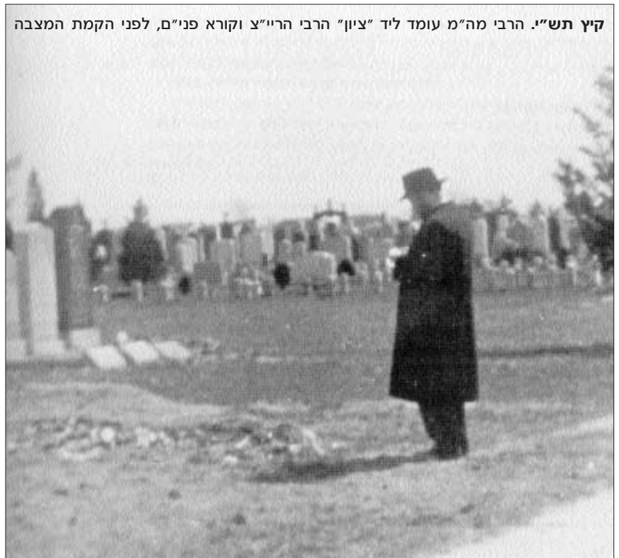
קיץ תש"י. הרבי מה"מ עומד ליד "צינור" הרבי הרי"צ וקורא פני"ם, לפני הקמת המצבה

הרבי המשיך לדבר אודות עצמו, ובין הדברים אמר: גלוי וידוע לפני מי שאמר והיה העולם שאיני כדאי והגון לכך.