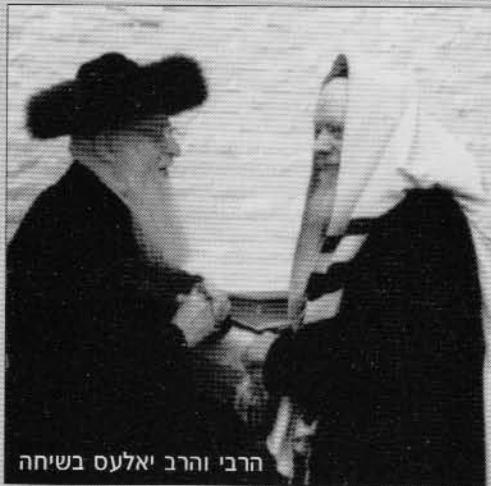
הרבי והרב יאלעס בשיחה