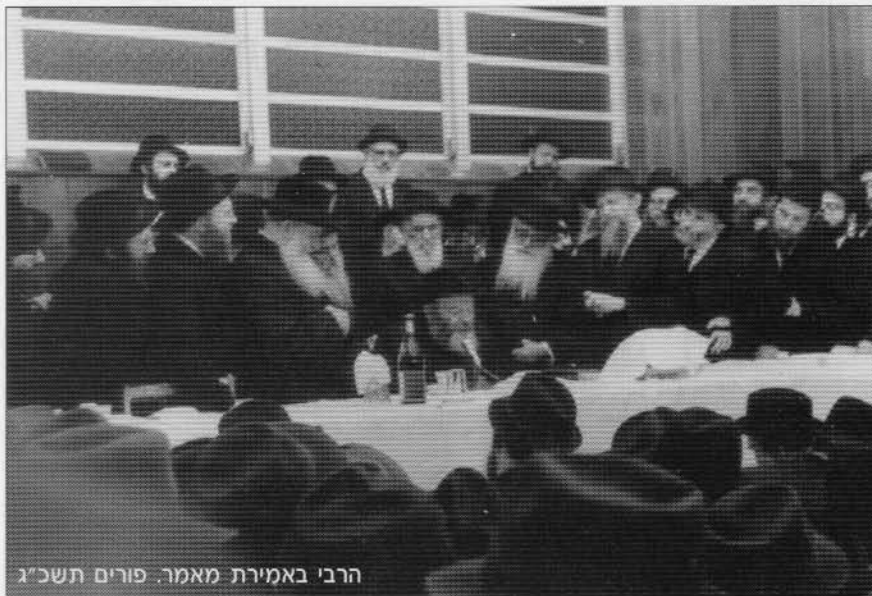
הרבי באמירת מאמר. פורים תשכ"ג