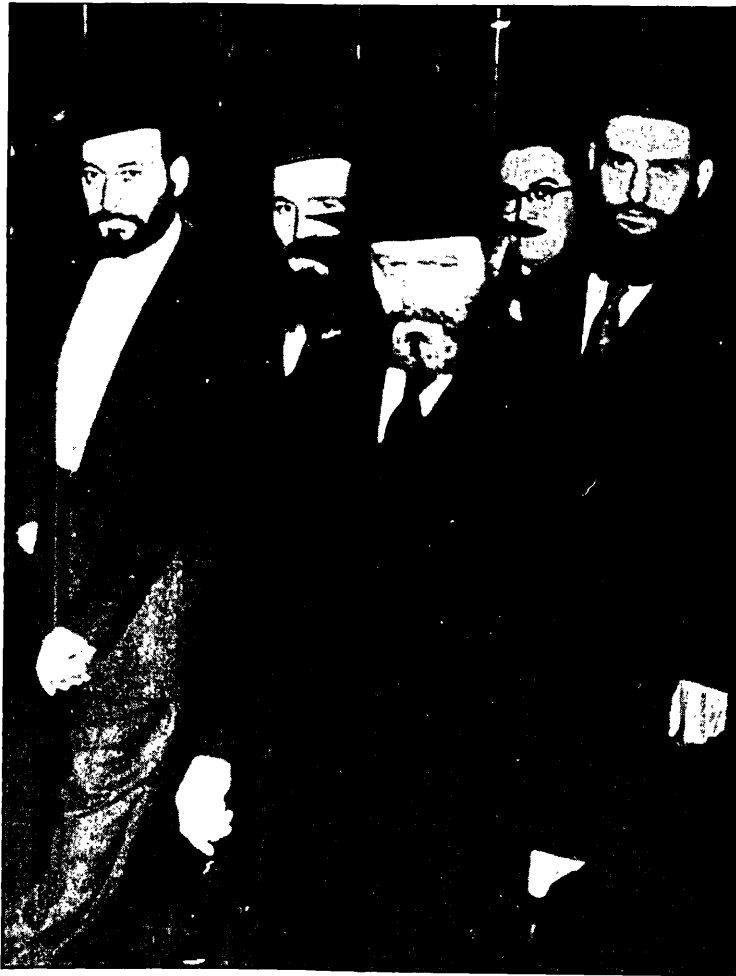
תמונה נדירה בה נראה כ"ק אדמו"ר שליט"א צועד לעבר מקום ה"חופה" ל"סידור קידושין" בחתונת א' מאנ"ש שי' בשנים הראשונות לנשיאותו.

וזוהי ההוראה שכדי לפעול על הבנים והבנות שיהיו כדבעי, ואפילו על "הצאן צאני", על הענינים הגשמיים, אי אפשר להיות "מופשט" מעניני העולם, ולהיות למעלה מ"עשרה טפחים", "און דער עולם הזה וועט זיך שפאצירן ווי ער וועט וועלן", אלא עליו להתייגע, ולא לישון בלילות עד שיפעל על הילדים שיהיו "בני יעקב".