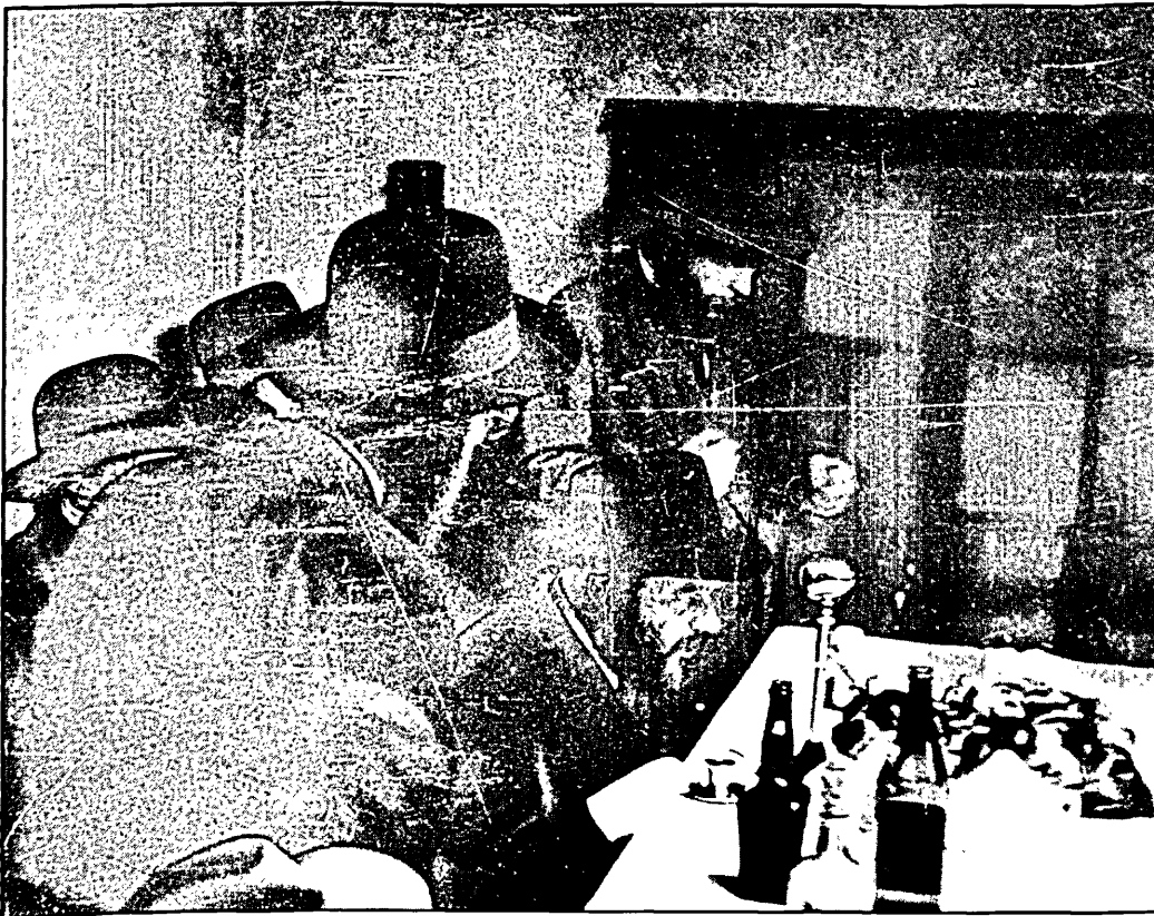
כ"ק אדמו"ר שליט"א מעודד בידו הק' את השירה בהתוועדות י"ט כסלו ה'תשי"א.

כל הקהל התחיל לנגן את הניגון הנ"ל, וכ"ק אדמו"ר שליט"א הניף את ידיו הק' בעוז להגברת השמחה, לפתע הפסיק כ"ק אדמו"ר שליט"א לנגן, כל הקהל השתתק. ואמר כ"ק אדמו"ר שליט"א, כל נברא הוא מוגבל, כי הוא מוגדר בהגדרות הגוף, והעצה היחידה לבטל