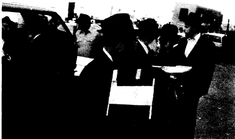
הספרים חוזרים ל-770

השמועה אומרת כי במזכירות קיבלו הוראה שבאם יגיעו הספרים משך זמן שהותו של הרבי שליט"א באוהל, ישלחו כמה מהם לשם. כשעה לאחר מכן הגיעו הספרים (בתוך רכב מסחרי, מלווה בעוד כמה מכוניות) הם הובאו בארגזים, שלושה-עשר במספר, ושקית ניילון נוספת.