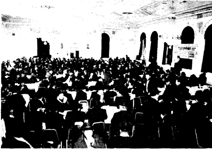
מאות השלוחים באולם הגיזאיש סנטרי

אח"צ התקיים ב-770 חלקו המרכזי של כנס השלוחים, הנואם המרכזי היה הרב ח.מ.א. חודקוב שליט"א שדיבר שעה ארוכה על ענין השליחות.