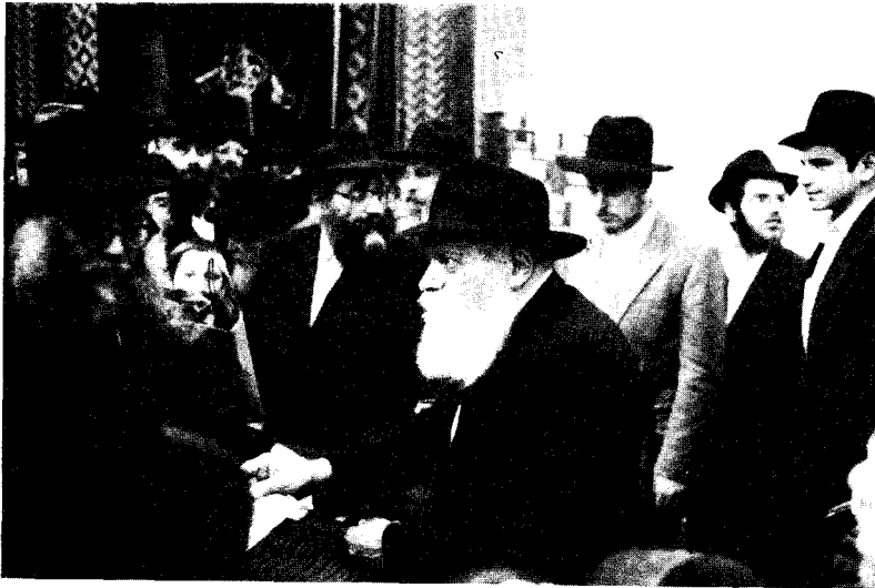
כ"ק אדמו"ר שליט"א בחלוקת הדולרים לישלוחים — ר"ח כסלו

רבים מן העוברים שאלו "ידו ביסט א שליח"?! (- האם הינך שליח?) כשעבר רב אחד שאלו כ"ק אדמו"ר שליט"א כני"ל, והלה השיב שהוא רב, הרבי שליט"א חייך אליו ועשה בידיו תנועת פליאה... מקרה דומה, כשעבר יהודי מבוגר אחד, שאלו כ"ק אדמו"ר שליט"א אם הוא שליח, והשיב שהוא משפיע, הרבי אמרו לו (בערך) "פאר מיר אליין נעם איך ניט"..." (בשבילי עצמי, אינני לוקח...).