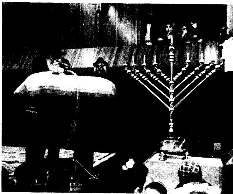
כִּיָּק אֲדַמְוִי"ר שְׁלִיטִי"א בֶּאֱחָת מִשִּׁיחֹת חַג הַחֲנוּכָה — בֶּרְקַע הַמְּנוֹרָה