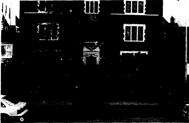
מאות השליחים על יד בנין 770